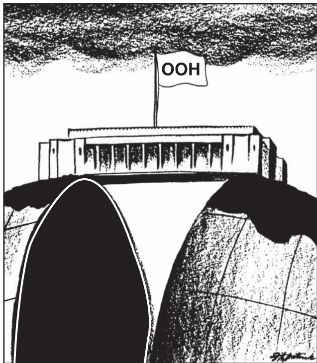
Заседание объявляется открытым

При ответе на вопрос 38 воспользуйтесь помещённой ниже карикатурой и своими знаниями по общественным наукам.