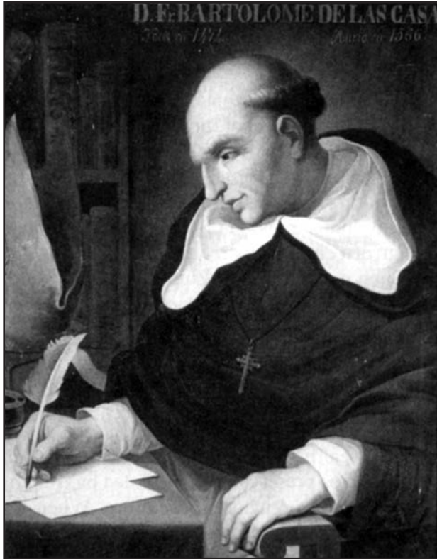
Bartolomé de Las Casas