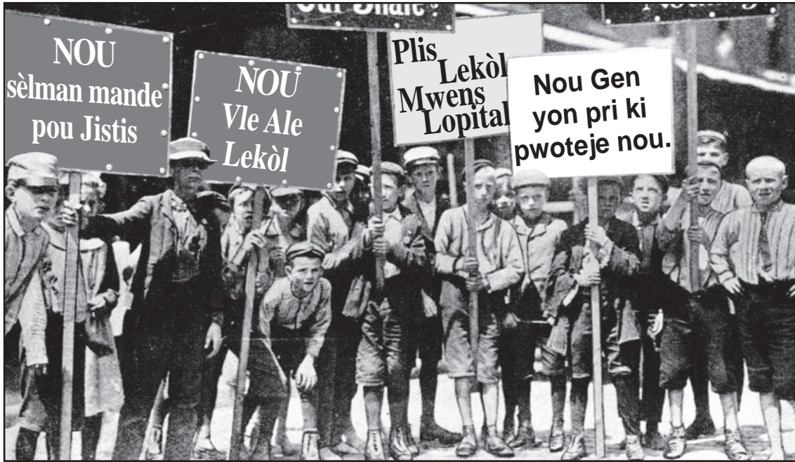
Sous: Stephen Currie, We Have Marched Together , Lerner Publications

"Mè" Mary Jones te li sou kondisyon ak danje travay timoun . Li te òganize epi tou ankouraje timoun ak granmoun fè grèv.