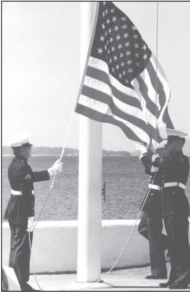
Fuente: Patricia Ryon Quiri, The American Flag , Children's Press, 1998 (adaptado)