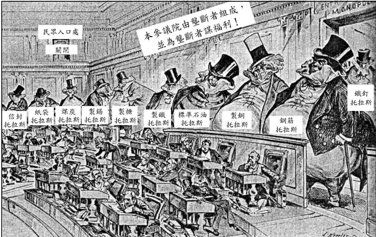
資料來源：Joseph J. Keppler, 1890 (經過改編)