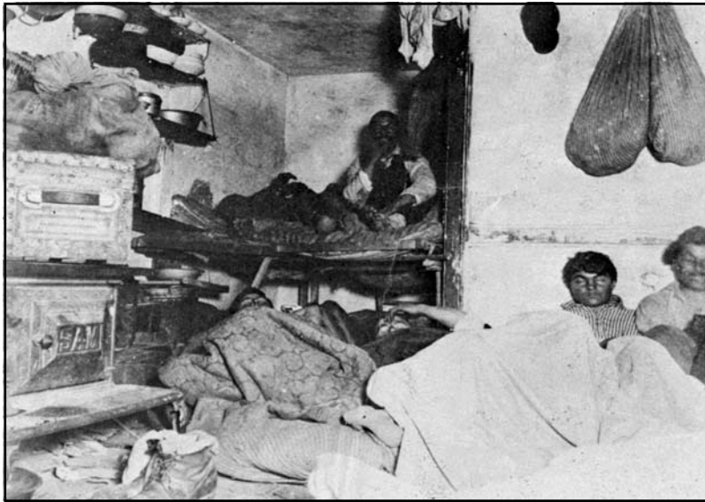
一位紐約市拾荒者的家 — 1890年