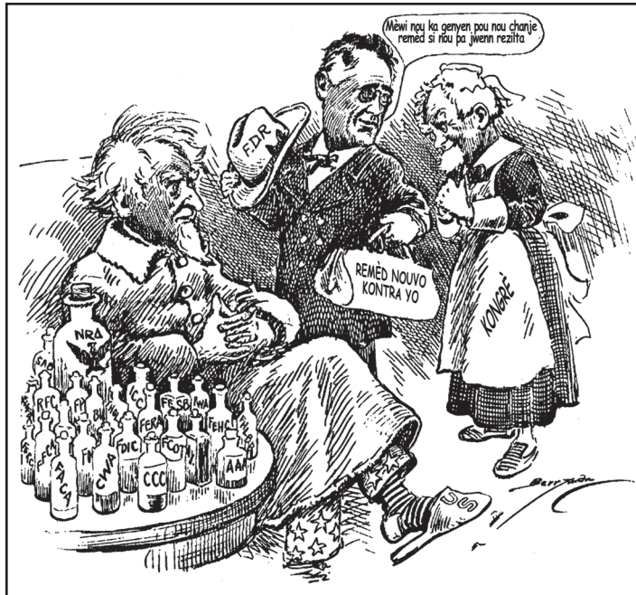
Sous: Clifford Berryman, Washington Star , January 5, 1934, Library of Congress (adapte)

6a Nan ti komik sa a, kilès doktè a reprezante? [1]