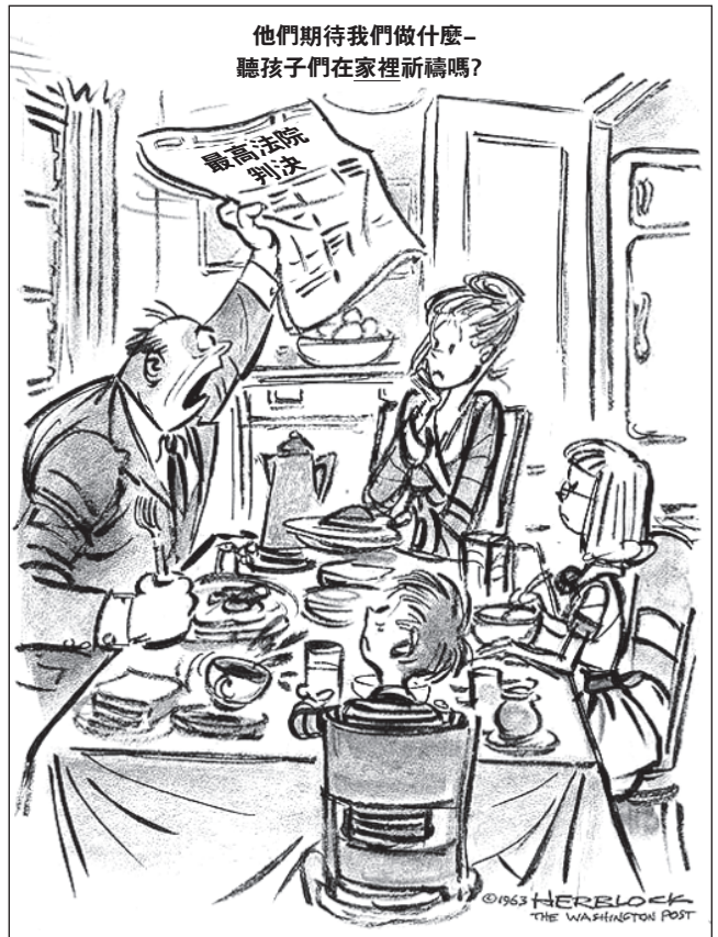
資料來源: Herblock, The Washington Post , June 18, 1963