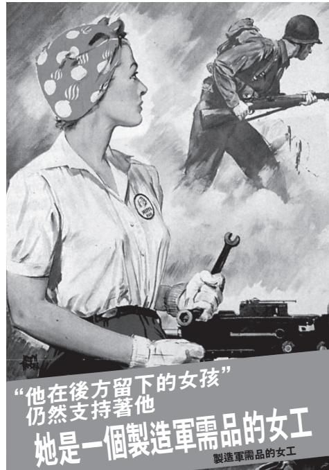
資料來源: U. S. Army, Adolph Treidler, 畫家, 1943