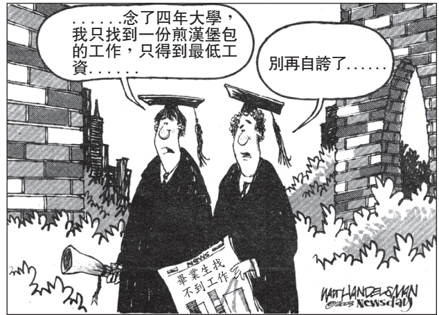
資料來源：Walt Handelsman, Newsday, 2003(經改編)