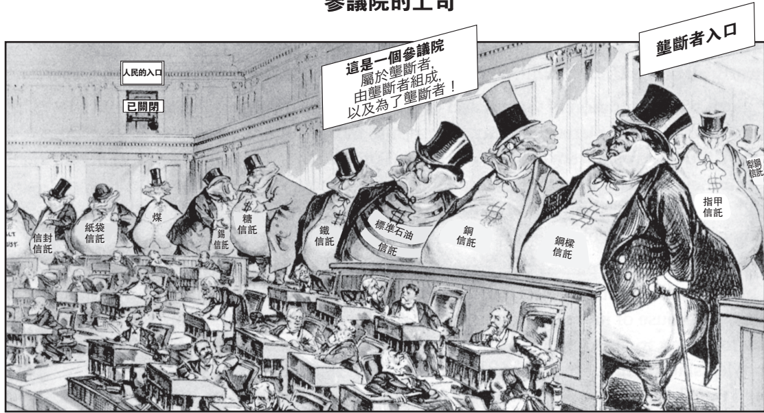
資料來源: Joseph J. Keppler, Puck , 1889 (經改編)

3a 約瑟夫·J·凱普勒(Joseph J. Keppler)在這幅漫畫中指出的一個政治問題是什麼？ [1]