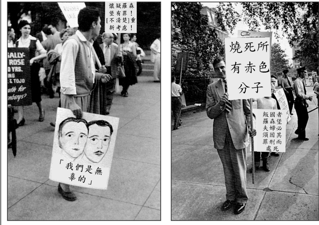
資料來源：Elliot Erwit, Magnum Photos (改編版)