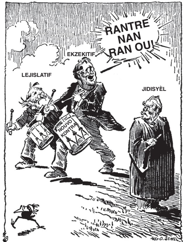
Sous: Fred O. Seibel, Richmond Times-Dispatch , 8 Janvyè, 1937 (adapte)

Baze repons ou pou kesyon 30 ak 31 sou desen pi ba a ak sou konesans syans sosyal ou.