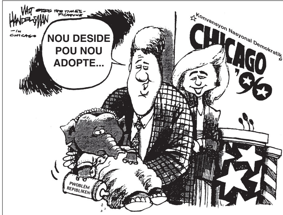
Sous: Walt Handelsman, The Times-Picayune (adapte)

Baze repons ou pou kesyon 40 sou desen pi ba a ak sou konesans syans sosyal ou.