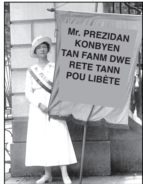
Sous: Miles Harvey, Women's Voting Rights , Children's Press