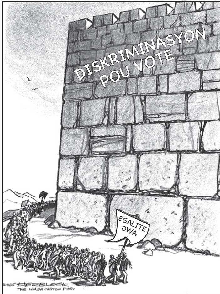
Sous: Herblock, Washington Post , March 21, 1965 (adapte)

9 Jan ti komik Herblock sa a montre li, kisa ki te yon objektif espesifik manifestan ki tap mache pou genyen egalite dwa yo? [1]