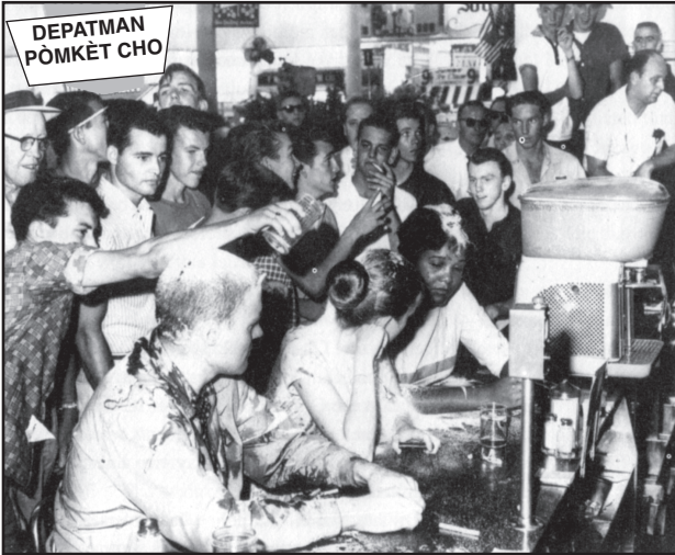
Sous: Juan Williams, Eyes on the Prize , Viking

Etidyan kolèj yo fè fas ak yon gwoup advèsè nan yon kontwa manje pou “blan sèlman” nan sid nan lane 1963.