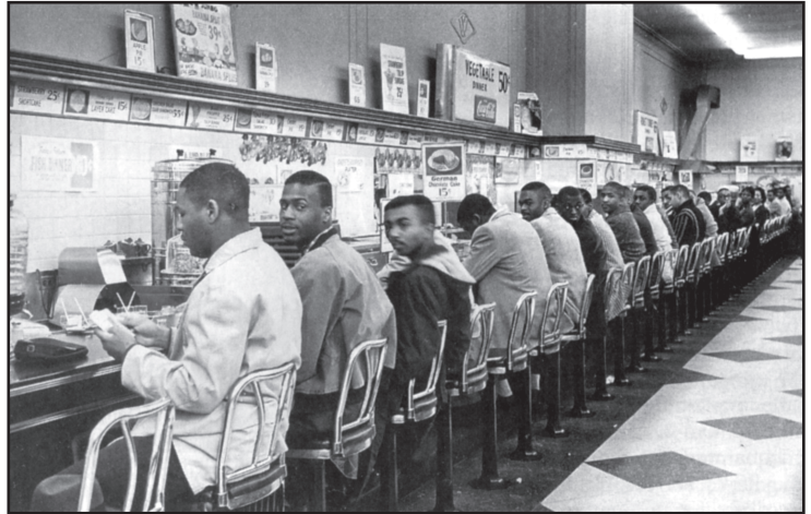
Sous: Gary Nash et al., The American People , Pearson Longman

Elèv kolèj Ameriken Nwa yo ap tann pou yo sèvi yo oswa pou yo mete yo deyò ak fòs nan yon kontwa manje “pou blan sèlman”.