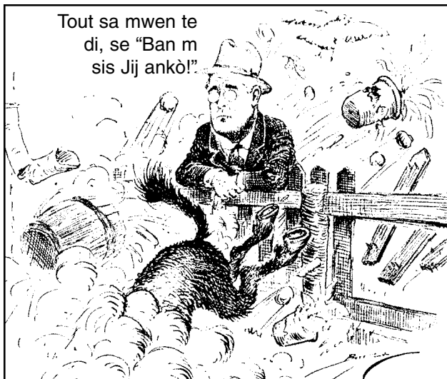
Sous: Clifford Kennedy Berryman, The Washington Star , 9 mas 1937 (adapte)

Baze repons ou pou kesyon 28 sou desen ki pi ba la, epi sou konesans ou nan syans sosyal.