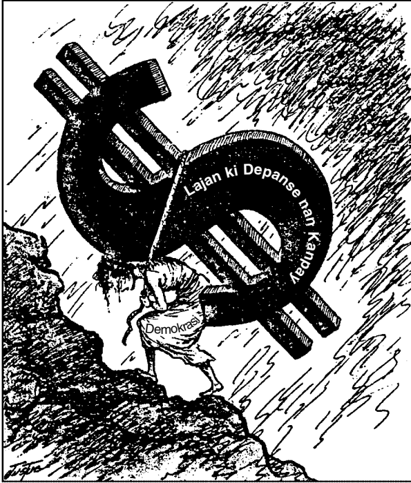
Sous: Justus, Minneapolis Star (adapte)

Baze repons ou pou kesyon 10 sou desen ki pi ba la a, epi sou konesans ou nan syans sosyal.