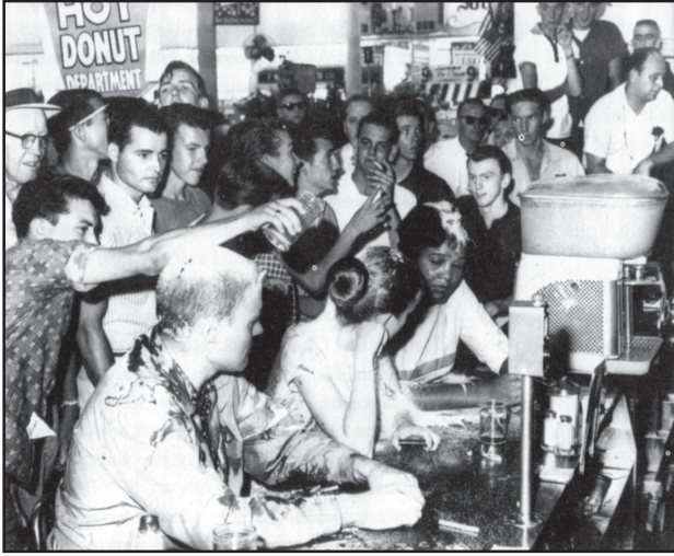
Источник: Juan Williams, Eyes on the Prize , Viking

Студенты колледжа столкнулись на Юге в 1963 г. с враждебной толпой у стойки кафетерия, предназначенной «только для белых».