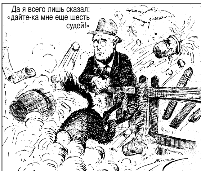
Источник: Клиффорд Кеннеди Берримэн [Clifford Kennedy Berryman], газета «Вашингтон стар» [The Washington Star], 9 марта 1937 г. (Адаптировано)

При ответе на вопрос 28 опирайтесь на помещенную ниже карикатуру и свои знания в области общественных наук.