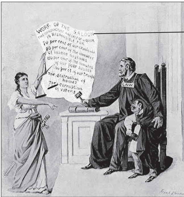
Fuente: Frank Beard, Fifty Great Cartoons , The Ram's Horn Press, 1899