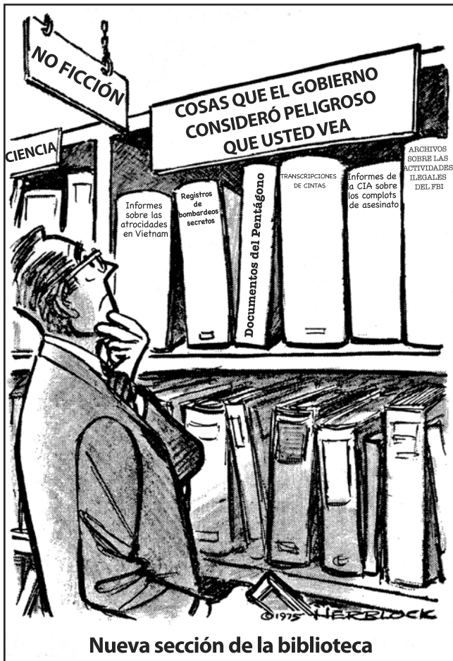
Nueva sección de la biblioteca

Base su respuesta a la pregunta 41 en la siguiente caricatura y en sus conocimientos de estudios sociales.