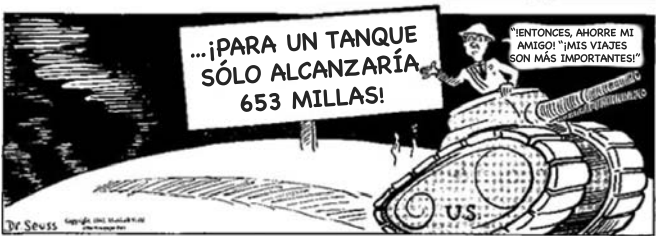
Fuente: Dr. Seuss, PM , April 7, 1942

34 Esta caricatura de la Segunda Guerra Mundial se utilizó para alentar a los estadounidenses a