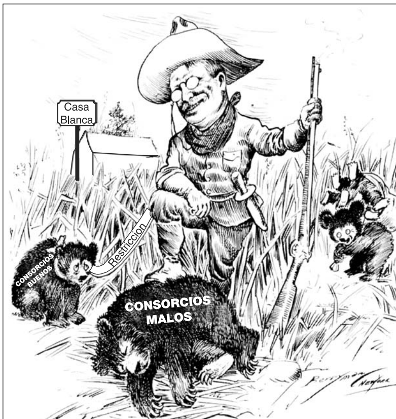
Fuente: Clifford K. Berryman, Washington Evening Star , October 11, 1907 (adaptado)

7b De acuerdo con el caricaturista, ¿cuál era la política del presidente Theodore Roosevelt hacia los consorcios? [1]