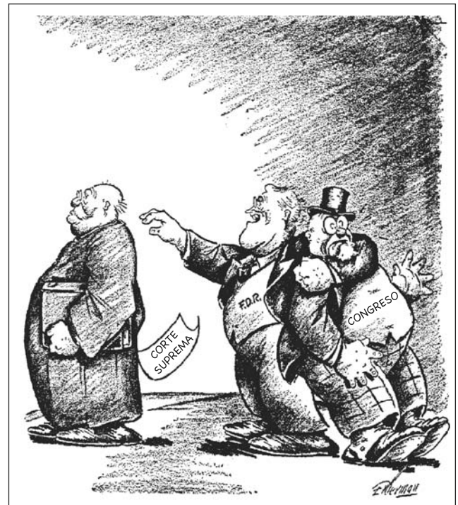
Fuente: Gene Elderman, Washington Post , January 7, 1937 (adaptado)

30 El dibujante hace una observación sobre los esfuerzos del presidente Franklin D. Roosevelt por