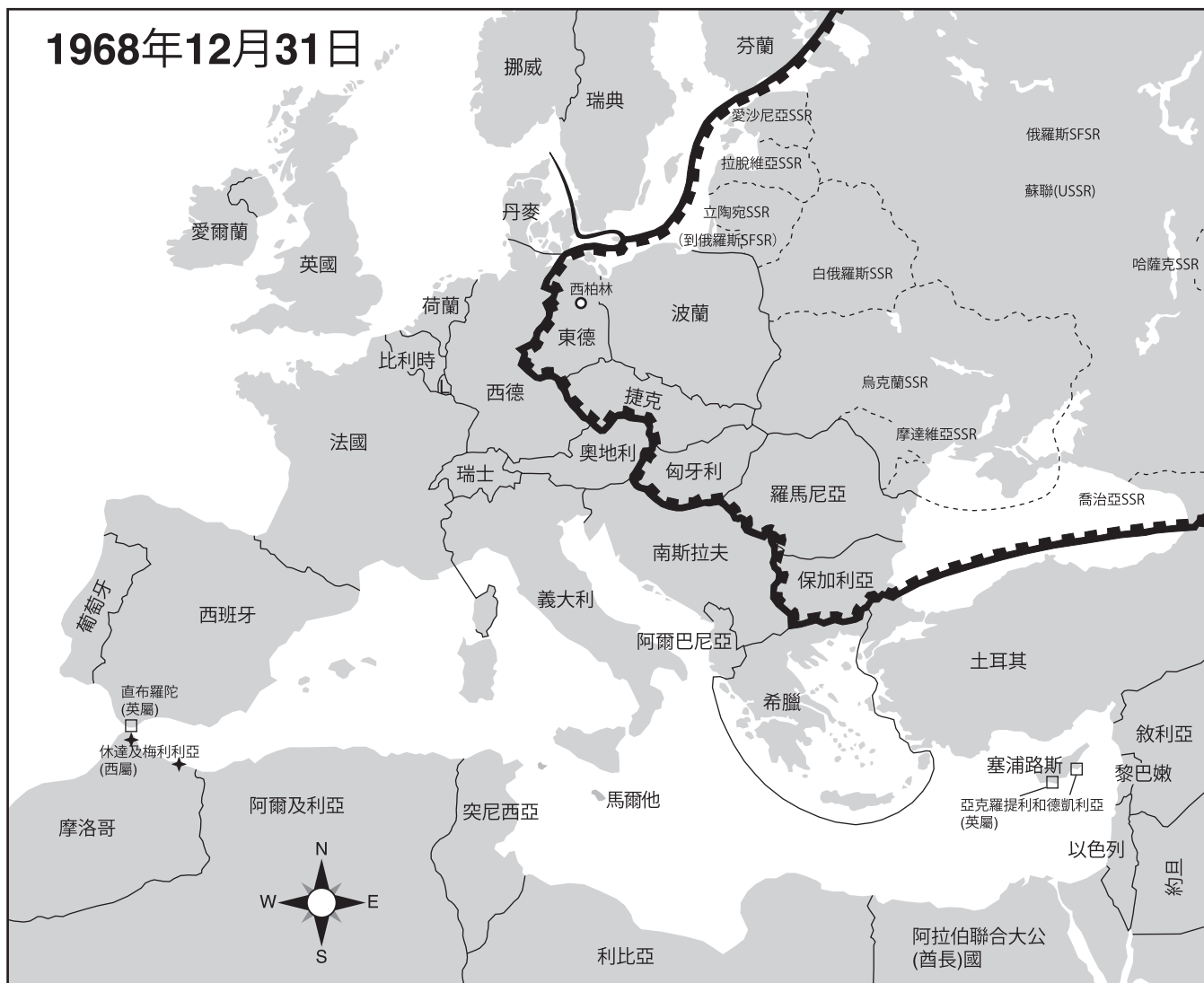
資料來源: Colin McEvedy, The New Penguin Atlas of Recent History: Europe Since 1815 , Penguin Books (經改編)

36 1968年間，標明為愛沙尼亞、白俄羅斯和摩達維亞蘇維埃社會主義共和國 (Estonian SSR, Belorussian SSR, and Moldavian SSR) 的區域是指