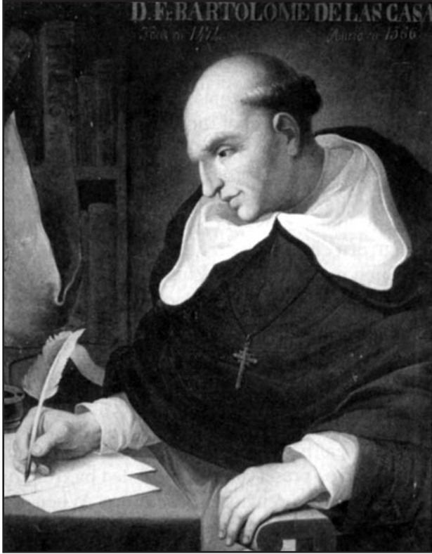
Бартоломе де Лас Касас