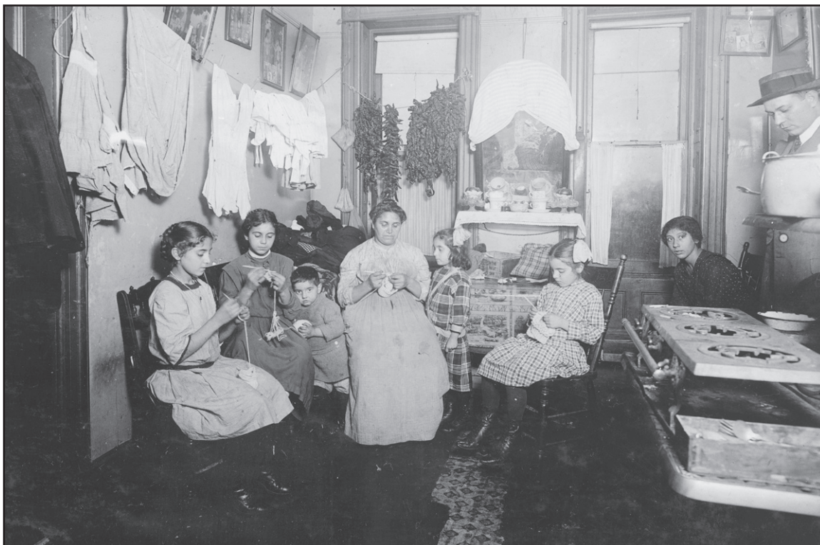
Sous: Lewis W. Hine, November 1912, Library of Congress

5 Dapre foto sa a, idantifye yon rezon ki fè viv nan yon kay pou travayè te souvan difisil pou imigran yo. [1]