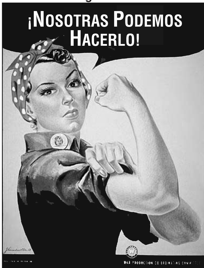
Fuente: J. Howard Miller, "We Can Do It," de Rosie la Remachadora Comité Coordinador de Producción durante la Guerra (adaptado)

4 ¿Qué muestra este afiche sobre la función de las mujeres en la fuerza laboral durante la Segunda Guerra Mundial? [1]