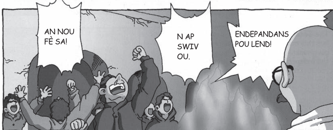
Sous: Y. kids, Great Figures in History: Gandhi , YoungJin Singapore

8 Dapre ekstrè sa a nan woman grafik la, endike yon aksyon Gandhi sijere pèp endyen an te fè kont Britanik yo. [1]