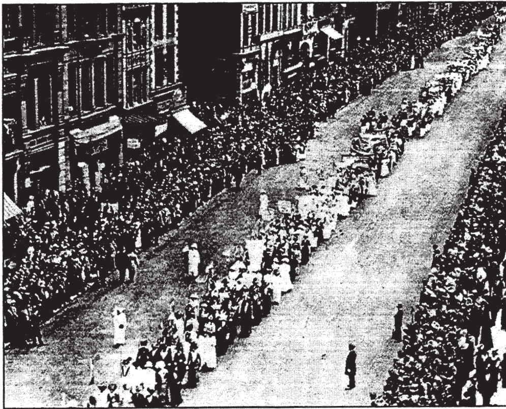
Sous: Miles Harvey, Women's Voting Rights , Children's Press

Ni gason, ni fanm te mache nan parad oswa pote pankat. Gen anpil moun ki te ale nan parad sa yo.