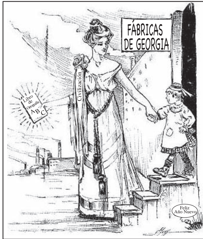
El estado de Georgia acoge la aplicación de la nueva Ley sobre la Mano de Obra Infantil.