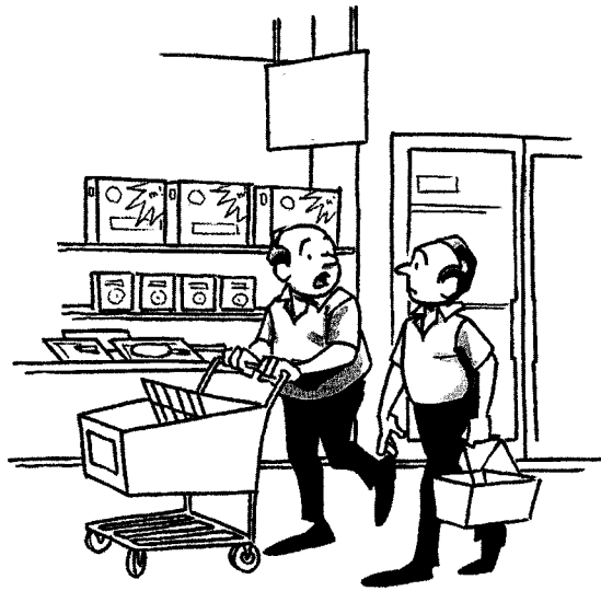
— Bunny Hoest & John Reiner, "Laugh Parade," Parade (adapted)

33 In Spanish, write a story about the situation shown in the picture below. It must be a story relating to the picture, not a description of the picture. Do not write a dialogue.