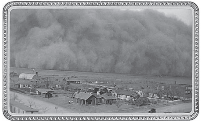
Fuente: Dust Storm , Franklin D. Roosevelt Presidential Library and Museum

Base sus respuestas a las preguntas 29 y 30 en la siguiente fotografía y en sus conocimientos de estudios sociales.