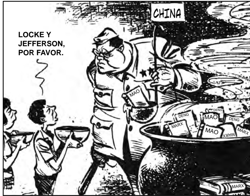
Fuente: Henry Payne, Brief Review in Global History and Geography , Prentice Hall, 2003 (adaptado)

Base sus respuestas a las preguntas 16 y 17 en la siguiente caricatura y en sus conocimientos de estudios sociales.