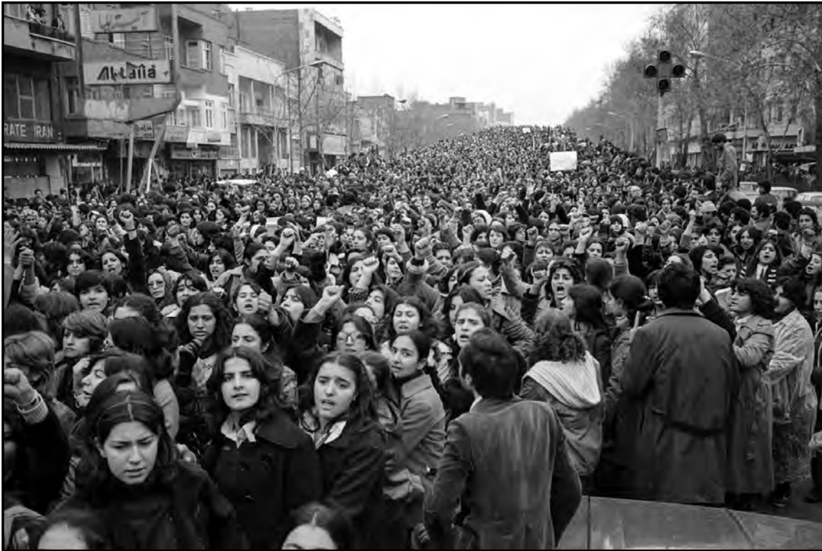
March 1979