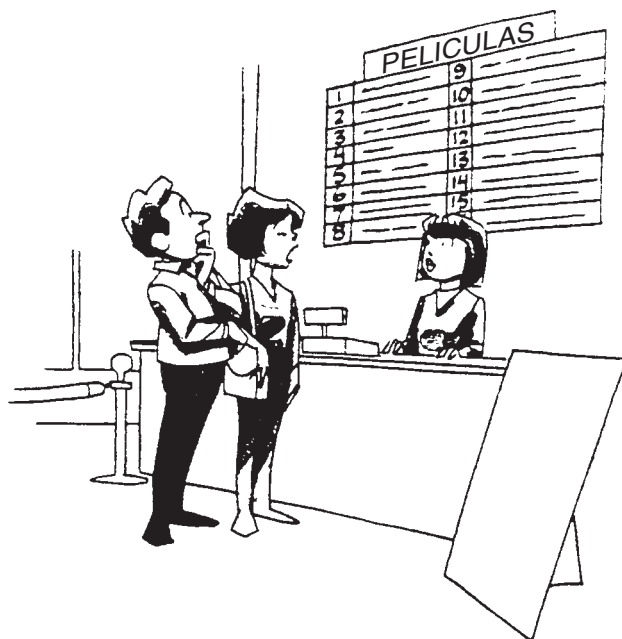
— Bunny Hoest & John Reiner, "Laugh Parade," Parade (adapted)

33 In Spanish, write a story about the situation shown in the picture below. It must be a story relating to the picture, not a description of the picture. Do not write a dialogue.