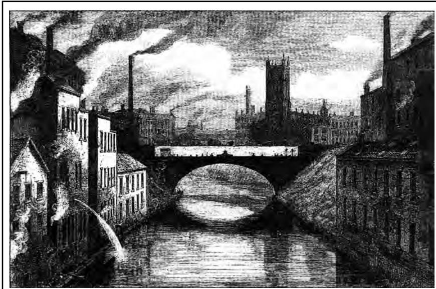
Pon Blackfriars se nan Manchester, ann Angletè sou Larivyè Irwell la.