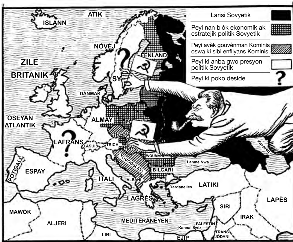
Sous: Leslie Illingworth, Daily Mail , June 16, 1947 (adapte)