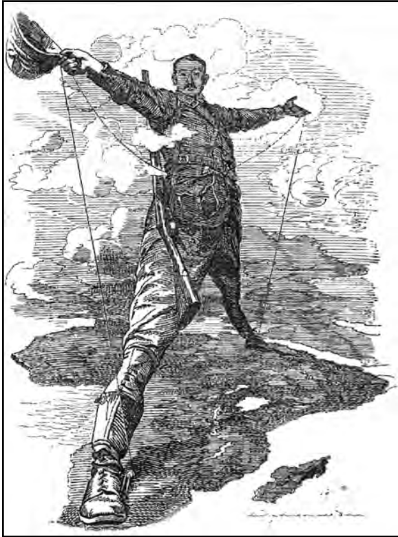
Sous: Punch , 1892 (adapte)