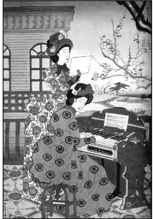
Sous: Hashimoto Chikanobu, December 1887 (adapte)