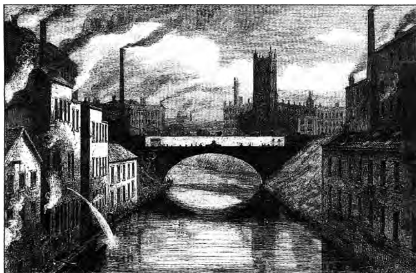
Мост Блэкфрайарз находится в Манчестере, Англия, над рекой Ирвел.