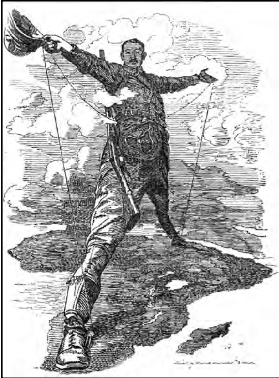
Источник: Punch , 1892 (адаптировано)