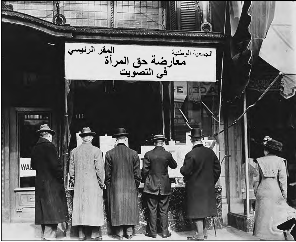
المصدر: Library of Congress, ca. 1911

أبدى العديد من الرجال اهتمامًا بحُجج مناهضي حصول المرأة على الحق في التصويت.