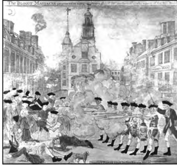
المصدر: Engraved and printed by Paul Revere, Library of Congress, Prints and Photographs Division

”المجزرة الدامية التي ارتكبتها فرقة من الفيلق التاسع والعشرين في شارع كينغ ستريت، بوسطن، بتاريخ 5 مارس/آذار عام 1770.“