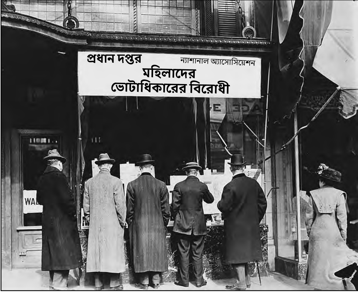
ca. 1911

বহু পুরুষেরা ভোটাধিকার আন্দোলন-বিরোধীদের যুক্তির প্রতি আগ্রহ প্রকাশ করেন।