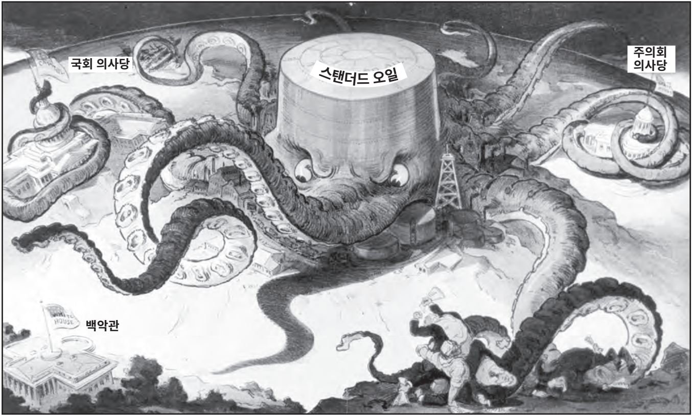
출처: Udo J. Keppler, Puck , September 7, 1904 (개정판)