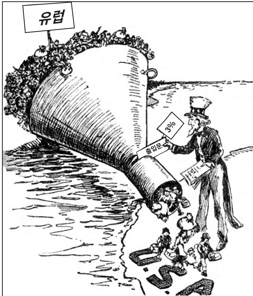
출처: Milton Halladay, Providence Journal (개정판)