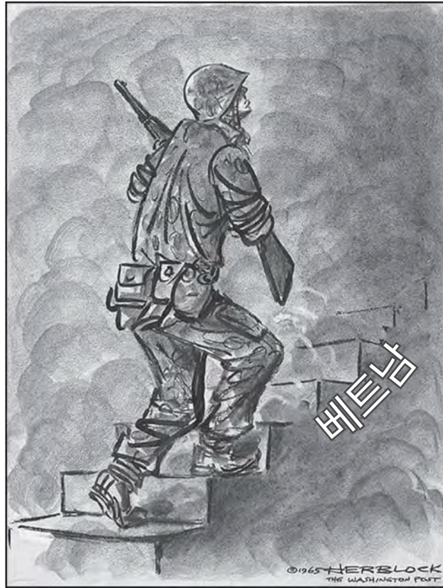
출처: Herblock, Washington Post , June 10, 1965