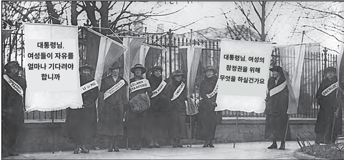
출처: Library of Congress (개정판)