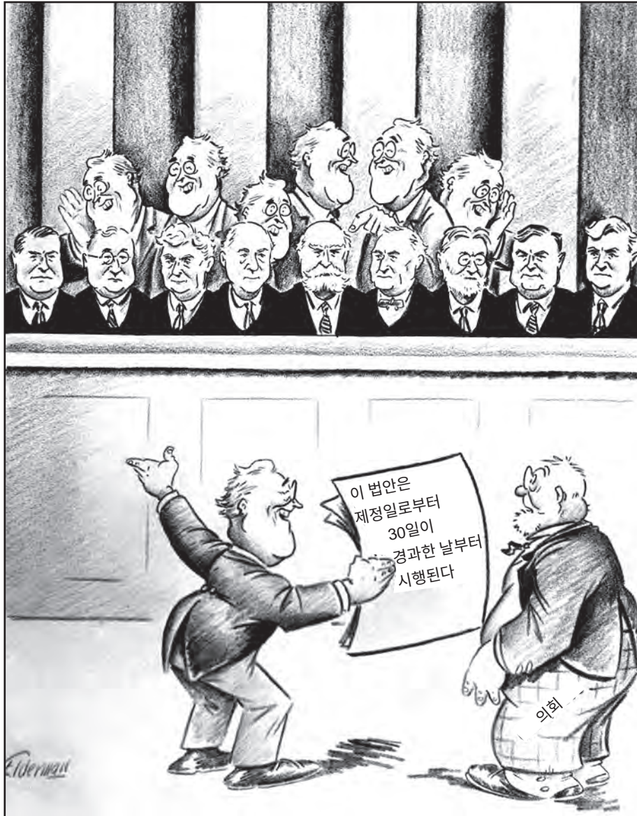
출처: Gene Elderman, Washington Post , February 6, 1937 (개정판)

20 다음 중 프랭클린 D. 루스벨트 대통령이 삽화에서 보여주는 조치를 제안한 주된 이유는?