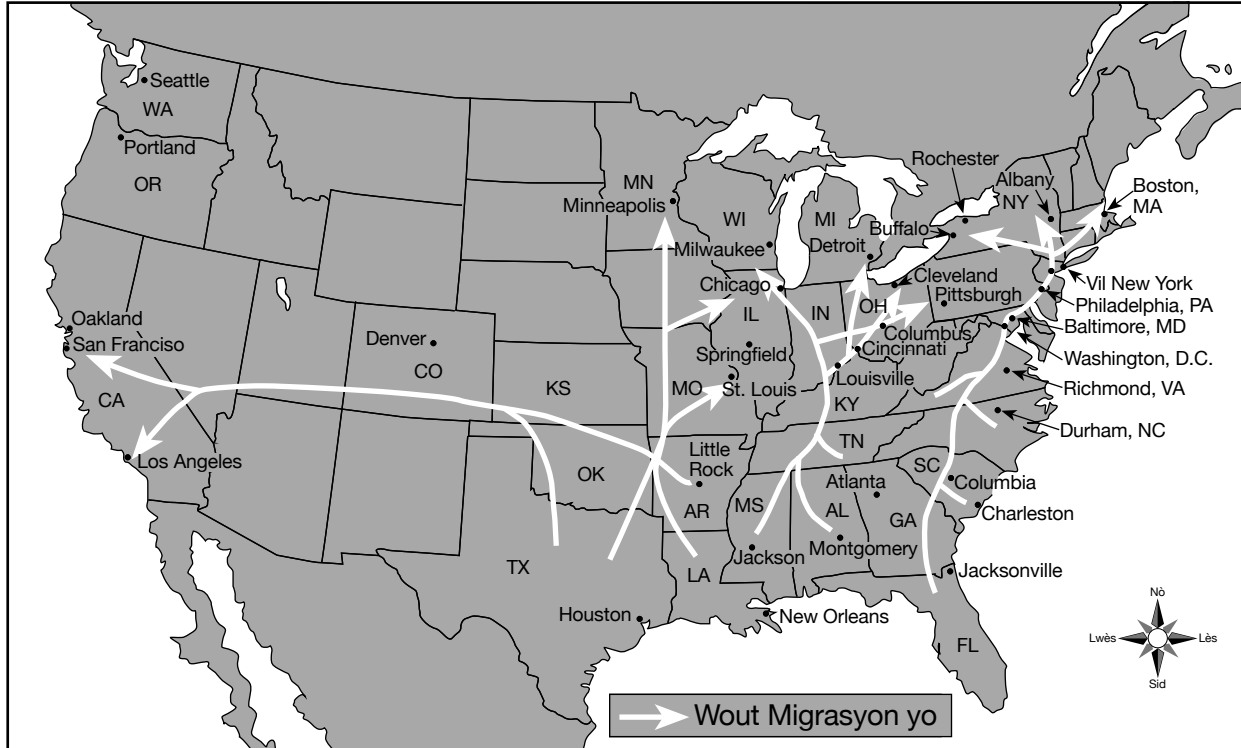
Sous: Michael Siegel, Rutgers Cartography, 2005 (adapte)

15 Ki sa ki te yon rezon prensipal pou mouvman moun yo jan sa montre sou kat jewografik sa a?