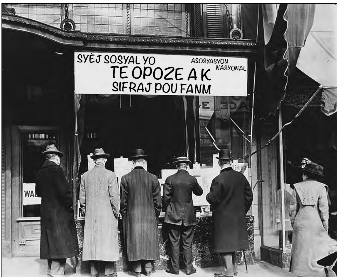
Sous: Library of Congress, ca. 1911

Anpil gason te montre enterè nan agiman anti-sifrajis yo.