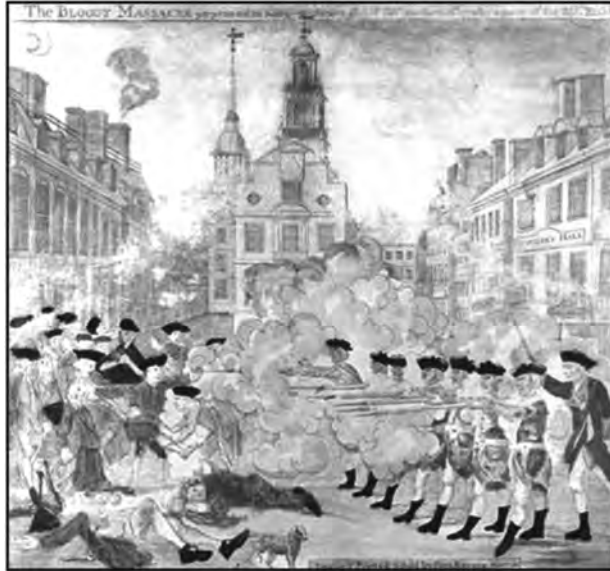
출처: Engraved and printed by Paul Revere, Library of Congress, Prints and Photographs Division

“1770년 3월 5일 제29연대 소속의 어느 무리가 보스턴 킹가에서 자행한 피의 대학살.”