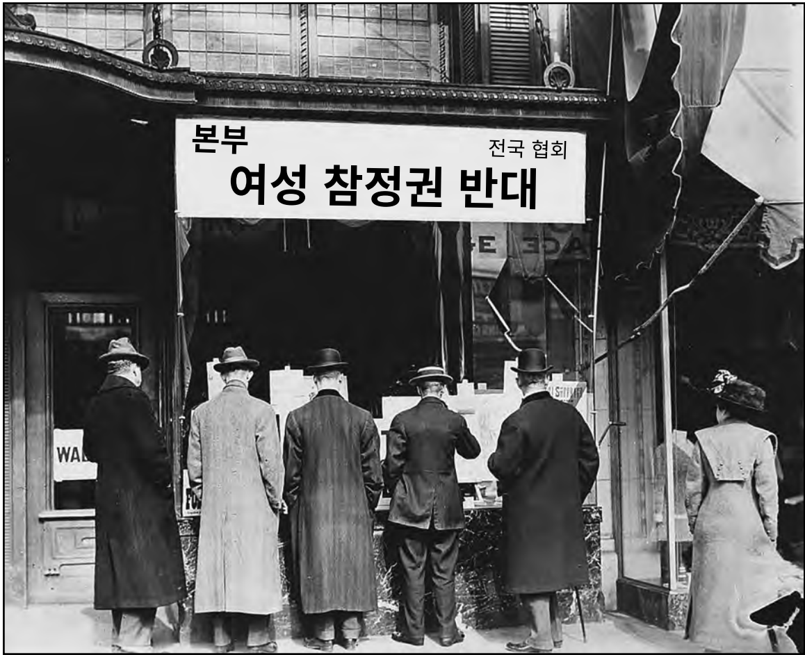
ca. 1911