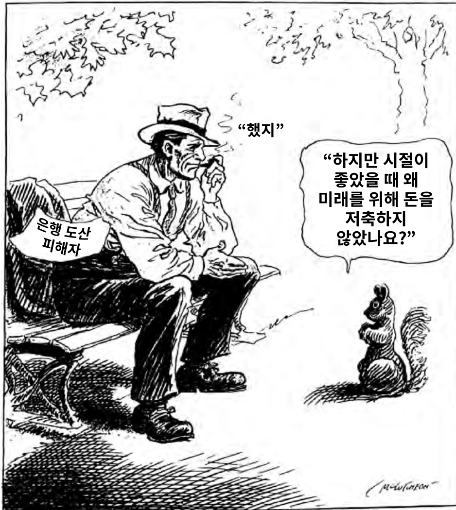
출처: John T. McCutcheon, Chicago Tribune , 1931 (개정판)

19 다음 중 허버트 후버(Herbert Hoover) 대통령과 공화당이 이 삽화에서 다룬 문제를 해결하지 못했던 이유는?