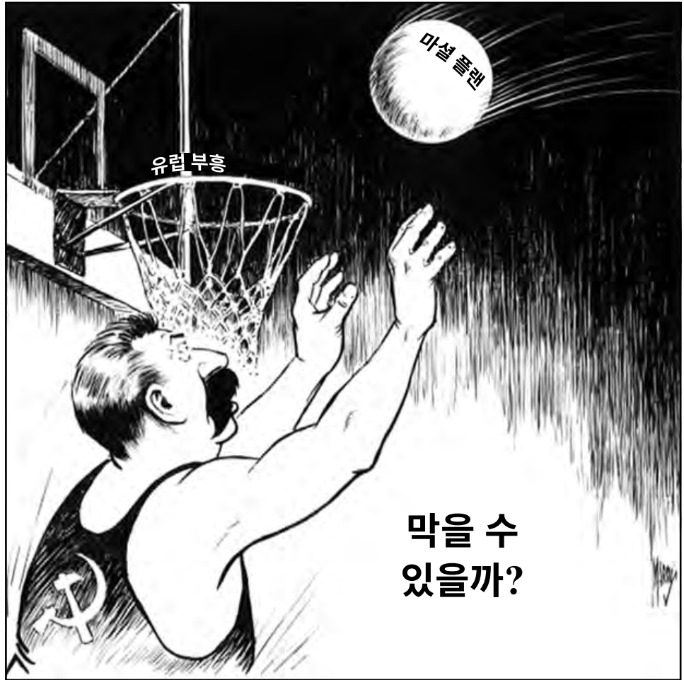
출처: Edwin Marcus, ca. 1947, Library of Congress (개정판)

23번과 24번 문제는 아래 삽화와 자신의 사회과학 지식을 바탕으로 답하십시오.