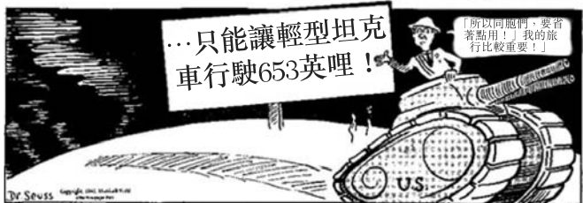
來源：Dr. Seuss, PM , April 7, 1942