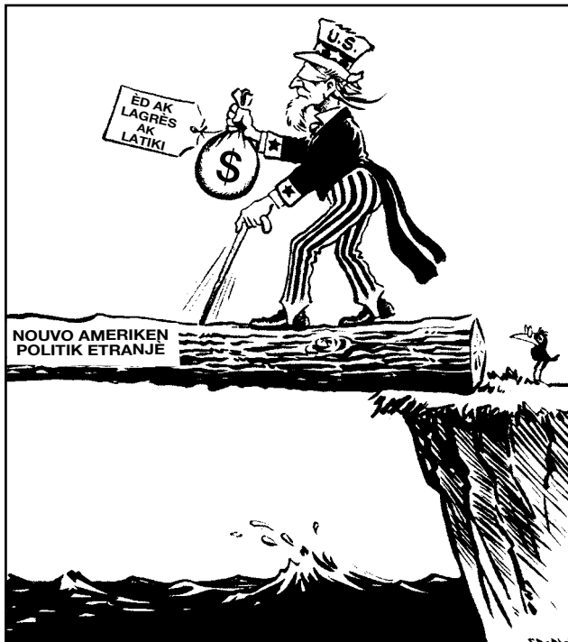
Sous: Fred O. Seibel, Richmond Times-Dispatch , March 14, 1947 (adapte)

38 Opinyon desinatè sa a eksprime a se ke “nouvo” politik etranjè Etazini sa a