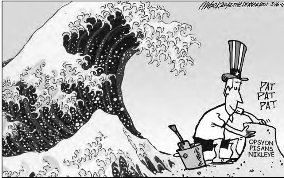
Sous: Mike Keefe, Denver Post , March 16, 2011

Sèvi ak desen ki anba la a ak konesans ou nan syans sosyal pou reponn kesyon 48 la.