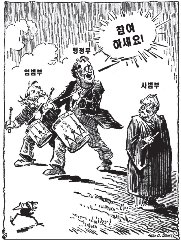
출처: Fred O. Seibel, Richmond Times-Dispatch, January 8, 1937 (개정판)