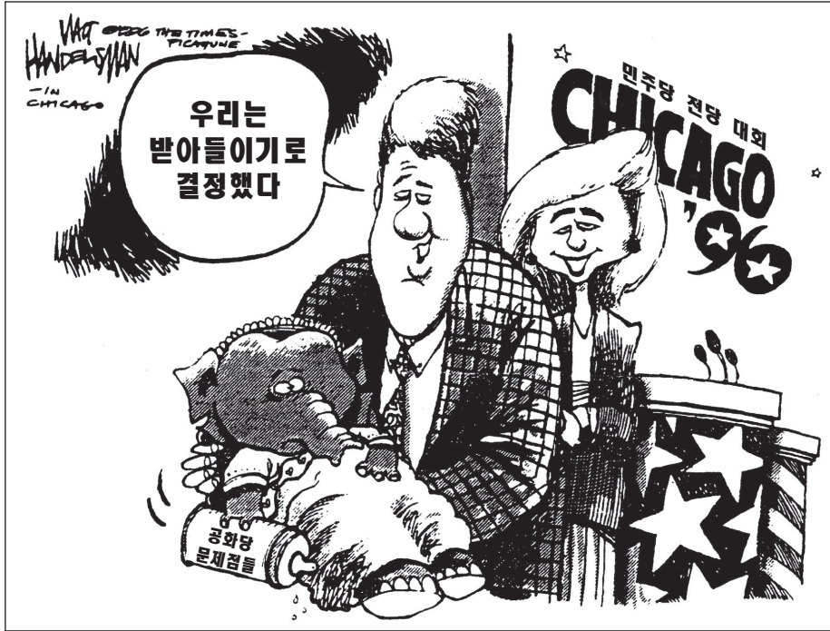
출처: Walt Handelsman, The Times-Picayune (개정판)