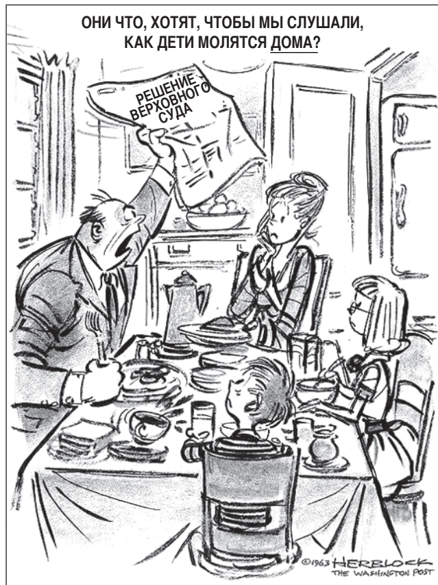
Источник: Herblock, The Washington Post , 18 июня 1963 г.

В ответе на вопрос 36 воспользуйтесь приведенной ниже карикатурой и своими знаниями по общественным наукам.