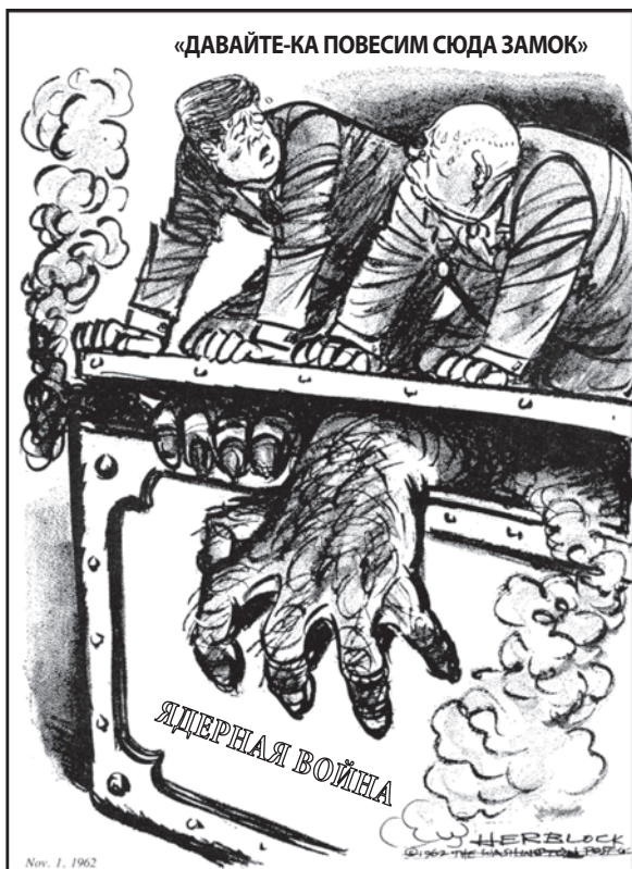
Источник: Herb Block, Washington Post , November 1, 1962 (адаптировано)

Президент Джон Ф. Кеннеди и советский премьер Никита Хрущев