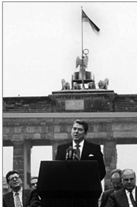
Речь президента Рональда Рейгана на западной стороне Берлинской стены возле Бранденбургских ворот, 12 июня 1987 г.

Источник: President Ronald Reagan, speech at the Brandenburg Gate, June 12, 1987