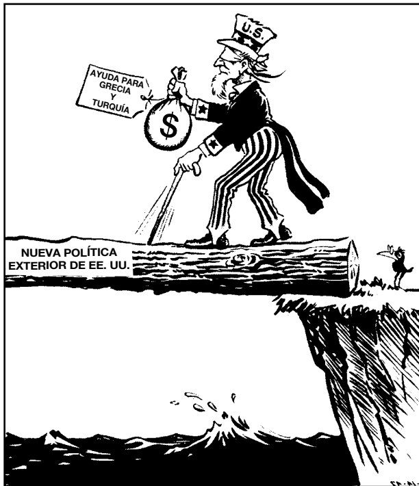
Fuente: Fred O. Seibel, Richmond Times-Dispatch , March 14, 1947 (adaptado)

38 El punto de vista expresado por este caricaturista es que esta “nueva” política exterior de los Estados Unidos